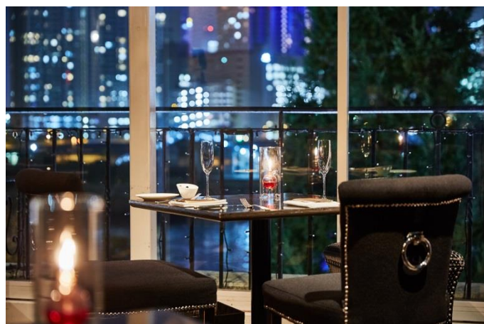
ディナータイム窓際のカップルシート