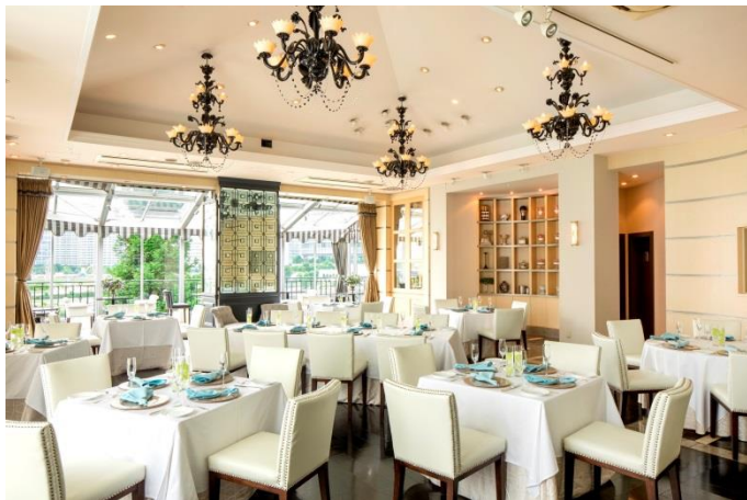
ランチタイム内観

【URL】 https://www.bestbridal.co.jp/restaurant/event_base/terrace_yokohama/