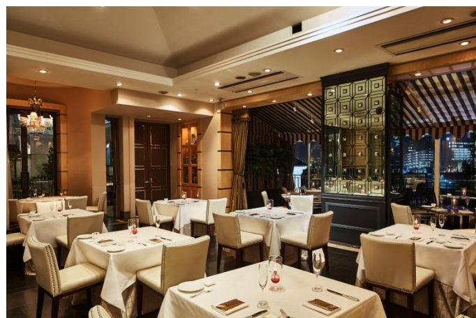
ディナータイム内観