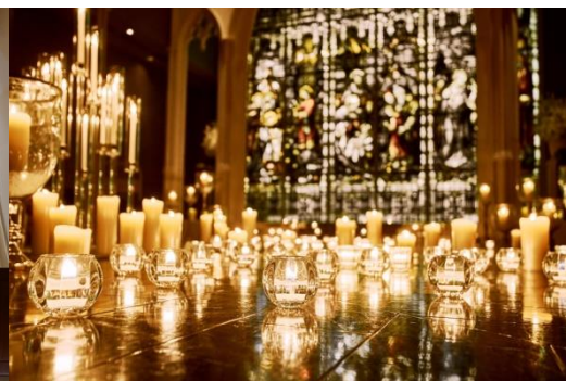
▲キャンドル写真はイメージ