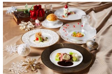
▲美女と野獣のクリスマスランチコース