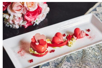
▲スペシャルディッシュ「LOVE LOVE LOVE」(850円にてオプション販売)