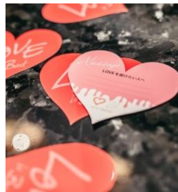
メッセージカード

会場となる「新浦安アートグレイス ウエディングコースト」は、美しい眺めと風が心地よい、4,300坪もの広大な敷地に建てられたゲストハウスウエディング会場。デザートbuffetの会場内には、ピンク色の花々やハート型のバルーンに彩られた限定フォトスポットが登場いたします。さらに、お客様同士で贈りあえるハート型のメッセージカードもご用意。普段は結婚式でしか足を踏み入れることのない特別な空間を一般開放して開催される限定デザートbuffetをご堪能ください。