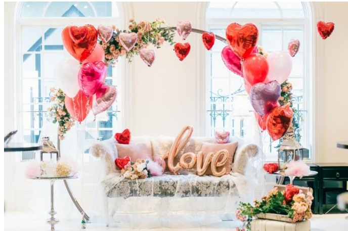
フォトスポットイメージ

『恋するいちごのデザートbuffet2020』は、旬のいちごを贅沢に使用し、ハートのモチーフがふんだんに散りばめられたスイーツや軽食、約20種類をbuffetスタイルでご堪能いただける4日間限定の特別イベントです。