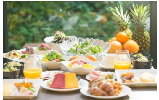
▲ヘルシー・ビューティー・フレッシュをコンセプトとした“シェフズ ライブ キッチン”でのフルブッフスタイル朝食で、身体の中から美しく