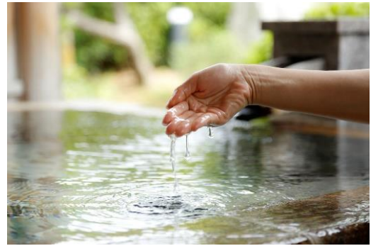
▲日本最古の美肌湯の“玉造温泉”