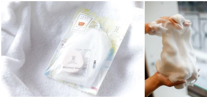
▲姫ラボ石鹸セット 姫ラボの泡はキメ細かくもっちりとした感覚。 美肌の秘訣が詰まっています。