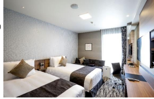
▲客室イメージ(デラックスツインルーム)