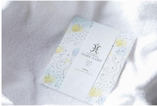
▲姫ラボフェイスパック