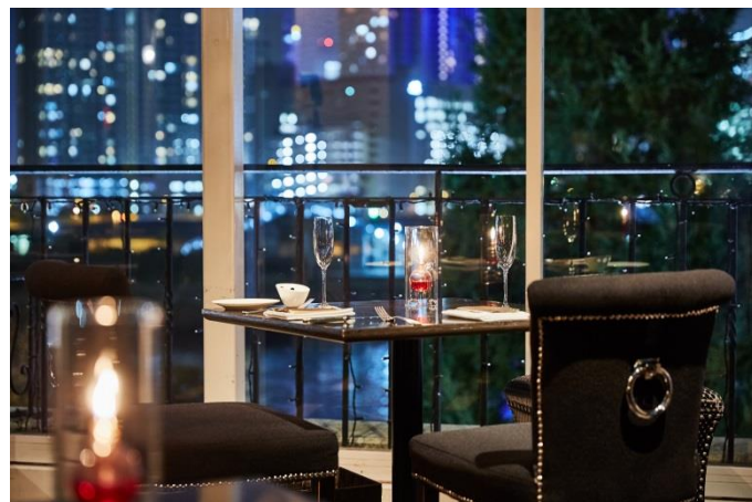
ディナータイム窓際のカップルシート