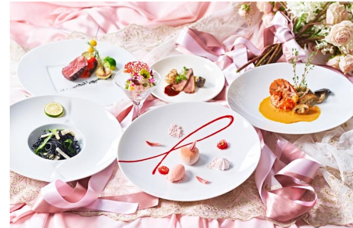
▲特製ディナーコース

ピンク色にライトアップされた「セントグレース大聖堂」を眺めながら、ピンクリボンモチーフのデザート付特製ディナーコースをお召し上がりいただいた後、通常は結婚式以外で入ることのできない大聖堂内で記念写真が撮れるスペシャルプラン。