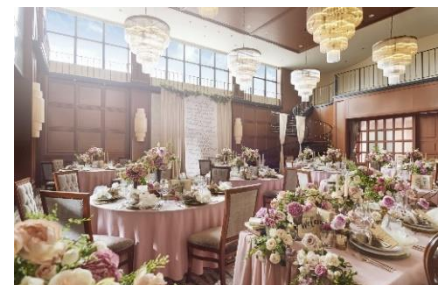
▲会場イメージ(オークルーム)