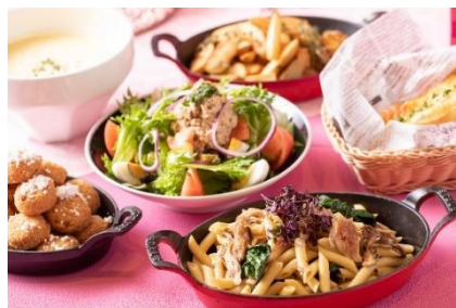
▲料理長特製の全6種のフードも提供