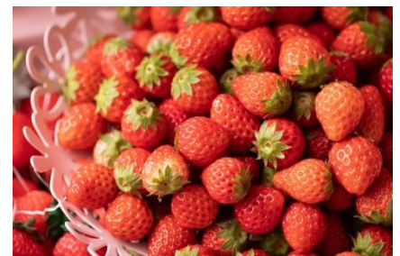
▲いちご好き必見！フレッシュいちごも食べ放題