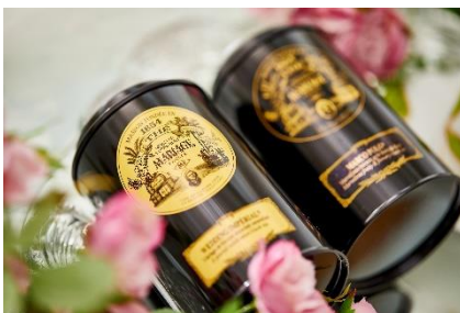
▲フランスの老舗紅茶も飲み放題