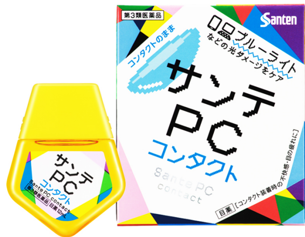
第3類医薬品 コンタクト装着時の不快感・目の疲れに

この度発売する新製品「サンテ PC コンタクト」は、パソコン仕事などによる目の疲れを改善する機能に加え、ソフト・ハードコンタクトレンズをしたまま使用でき、コンタクトレンズ装着などにより傷ついた角膜の修復を促進する有効成分を配合した目薬です。