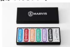
Black Box 7種・各25mL 特別価格5,661円