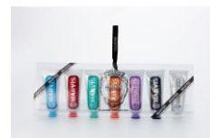
Flavor Collection 7種・各25mL 特別価格4,839円

UPPER HOUSE : https://shop.upperhouse.co.jp MARVIS : https://marvis.jp/