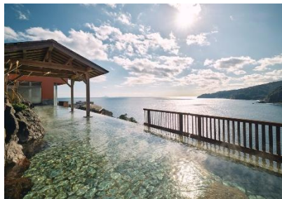
▲赤沢日帰り温泉館

伊豆の豊かな自然に囲まれた「赤沢温泉郷」は、全体敷地約25万㎡を超え、赤沢温泉ホテル（77室）や赤沢迎賓館（15室）などの宿泊施設、海と空が一体となる露天風呂を備えた日帰り温泉館、伊豆半島の清らかな海水を活用したスパやプールなど、多彩な施設が点在する大型複合リゾートです。日本を代表する総合リゾートとして、老若男女を問わず、家族やカップル、友人同士、海外からの旅行者まで、すべての方がそれぞれのスタイルで楽しめる海辺のリゾートを目指しています。