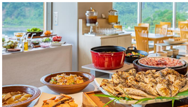
50種類以上が並ぶ朝食バイキング