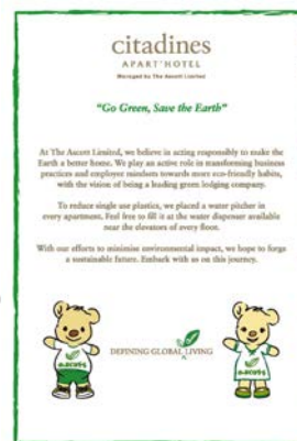
ペットボトル水廃止に関するお知らせ