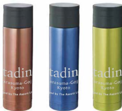
ステンレス製オリジナルタンブラー

また本年より、日本国内に展開されているシタディーンではペットボトル水の取りやめを推進しており、シタディーン京都烏丸五条がこれに加わったことで、全4軒が配布を取りやめることとなります。各施設ではウォーターサーバーを導入することで、ご滞在中の快適さを損なわずに環境への負荷を低減できる設備を整えております。この他、すでに備付けランドリーバッグの素材を環境負荷低減素材へ移行したのをはじめとして、施設内でのプラスチック使用物に関する環境に優しい代替品への差し替え、取りやめなどを今後更に推進し、持続可能な社会に向けての取り組みを進めてまいります。