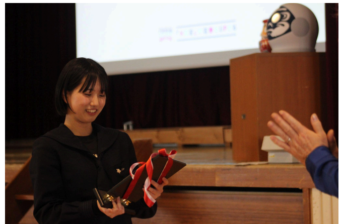
左:短歌成果発表会の様子 右:表彰される花巻北高の生徒