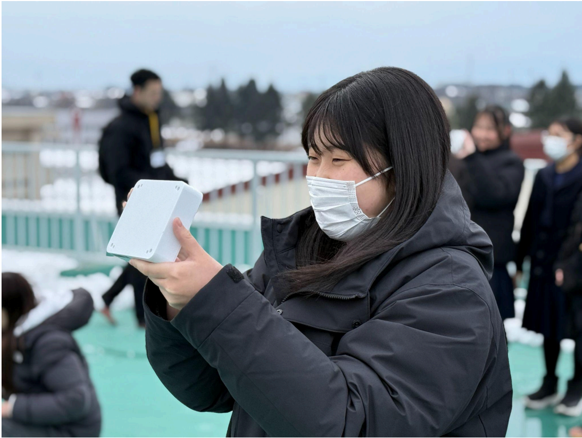
送信実験で高校生が通信機をYODAKAIに向ける様子 ※無線局の技術操作は無線従事者が実施