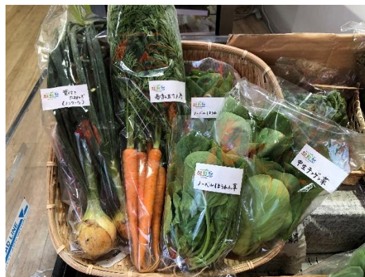
▲ロゴマークを付けて販売している自然栽培野菜

自然由来の「食」をイメージし、大地の茶色、植物（野菜）の緑色、水と空の青色をキーカラーとして、健やかな大地と自ら植物が芽吹く様子をシンボル化しています。このロゴが付いている商品が安心安全であることを伝えるとともに、お客様に親しみを感じていただけるようにデザインしました。また、「地球が持続可能な本来の姿となる」という願いを込めており、我々がそれを実現するために取り組んでいくという当社の意思を表しています。