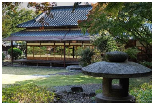
旧安川邸