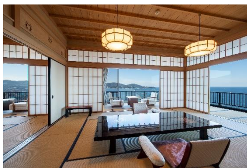
対局室 銀鱗荘 特別室和洋室「鶴」

※上記プレミアムツアー以外にも、第3局北九州対局は「大盤解説会」参加と「旧安川邸」対局室や北九州市内の観光がセットされたお手軽な1泊2日バスツアーも販売します。詳細は以下よりご確認ください↓