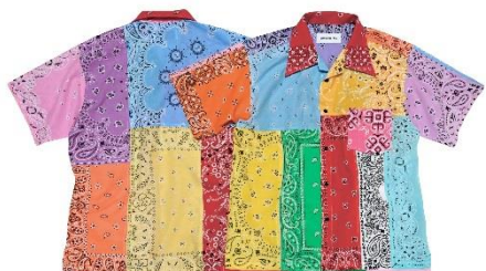
Bandana shirt ¥39,600(税込)