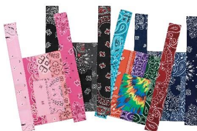
Mini convenience bag ¥8,800(税込)