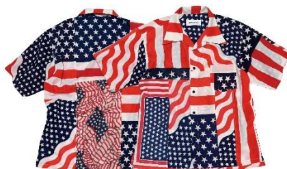
Nativeshortsleeve shirt ¥37,400(税込)