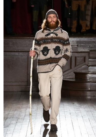
Knit ¥ 107,800

2020年秋冬コレクションは半世紀以上にわたり、山火事防止キャンペーンの象徴として、アメリカ国民に認知されているキャラクター“スモーキー・ザ・ベア”をコレクションに採用。