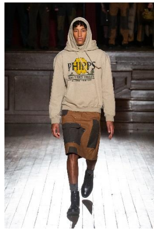
Tops/ ¥ 42,900