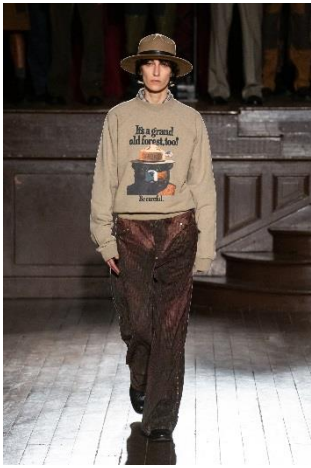
Tops/ ¥ 44,000

〈ドリス ヴァン ノッテン〉や〈マーク ジェイコブス〉でメンズデザインの経験したキャリアを持つ彼は、ブランド設立から一貫してサステイナブルなものづくりをし、ファッションを通じて環境問題や地球でいま起こっていることを伝え続けています。