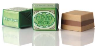
クレミノ ピスタチオ ほのかな塩気のある ピスタチオジャンドゥーヤのクレミノ