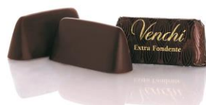
エクストラダーク ジャンドゥイオット ヘーゼルナッツペーストと75%ダークチョコ レートを使用したエクストラダークジャンドゥ イオット