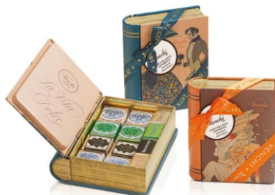
ミニブック缶 4グラフィックス 3,780円(税込) *全4柄