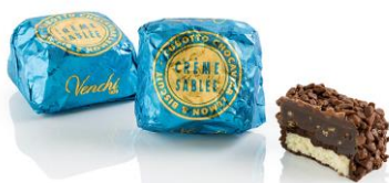
キュボット チョキヤビア クレームサブレ ジンジャーとルバーブのクリーム、ウエハース の2層をエクストラダークチョコレートシェルに 包み、ミルクチョコキヤビアをまぶしました