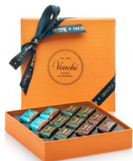
ジャンドゥイオット ギフトボックス 3,456円(税込)