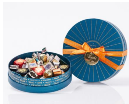
ミディウムホライズンハンパー 2 9,720円(税込)