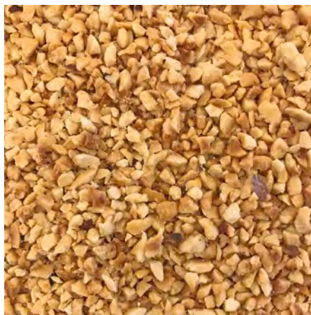
グルメコーン／カップ「ハーゼルナッツ」