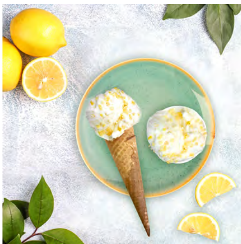
ジェラート「フィオール ディ リモーネ」

創業140年以上の歴史を持つイタリア発のチョコジェラテリア Venchi(ヴェンキ)の日本法人ヴェンキ・ジャパン株式会社は、2021年6月3日(木)、ヴェンキ直営各店にてジェラートの新フレーバー「フィオール ディ リモーネ」を発売します。