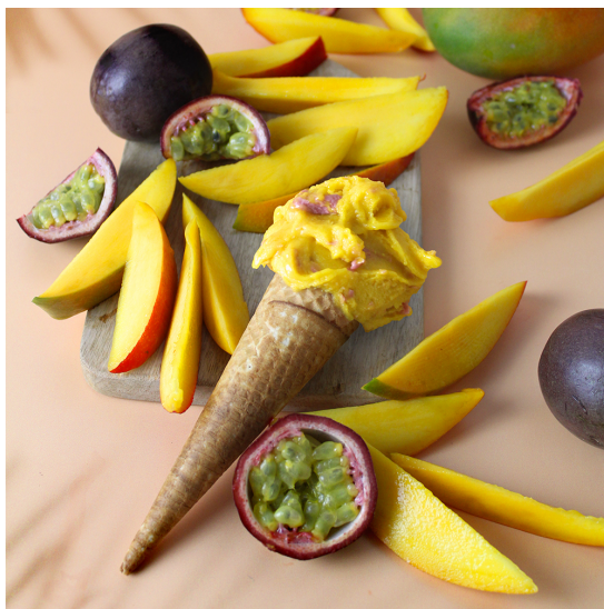
ジェラート 「マンゴー&パッションフルーツ ストラッチャテラ」

創業140年以上の歴史を持つイタリア発のチョコジェラテリア Venchi(ヴェンキ)の日本人ヴェンキ・ジャパン株式会社は、2021年7月1日(木)より、ヴェンキ直営各店にてジェラートの新フレーバー「パイナップル&ココナッツ」と「マンゴー&パッションフルーツ ストラッチャテラ」、そしてジェラートシェイクの「クレミノ」を新たに発売します。