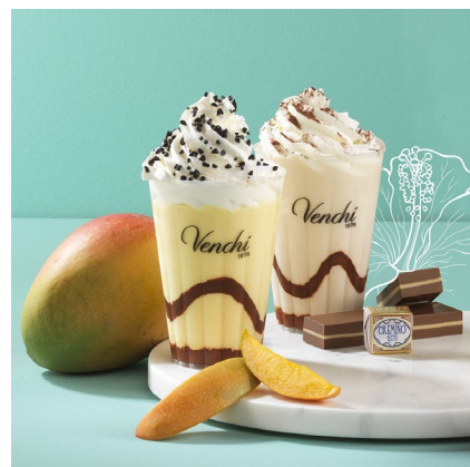
ジェラートシェイク「クレミノ」(写真右)

ジェラートシェイクにも新しいレシピ「クレミノ」が仲間入り。ヘーゼルナッツジェラートのシェイクにヴェンキ自慢のチョコレートスプレッド「スプレマ」と生クリーム、ココアパウダーをトッピング。濃厚なナッツとチョコレートの豊かな風味を堪能できます。夏のイタリア旅行気分を味わえる、本場のイタリアンジェラートをこの機会に多くの皆さまに楽しんでいただきたいと思います。