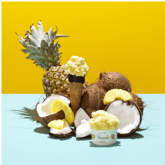
ジェラート「パイナップル&ココナッツ」