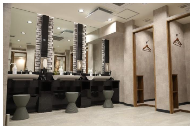
▲URBAN FIT24 ブランドイメージ