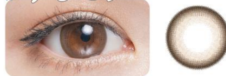
MOIST BROWN モイストブラウン