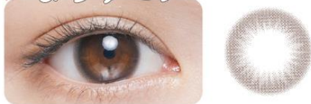
BABY BROWN ベイビーブラウン