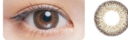
GAP BROWN ギャップブラウン