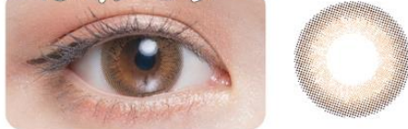
CHIFFON BROWN シフォンブラウン