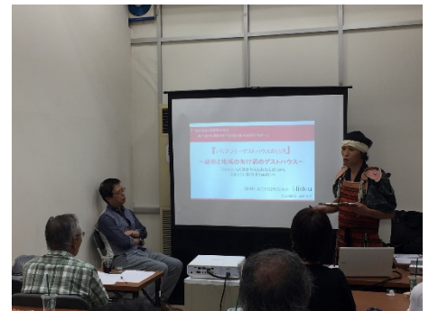
昨夏の鎌倉民泊開業セミナー風景