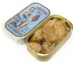
バカリャウ with オリーブオイル（炭火焼き） （ポルトガル） 価格:1,382円