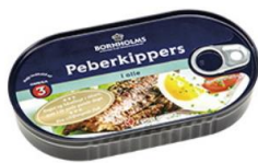
キッパーヘリング オイル・香辛料漬け （デンマーク） 価格:594円