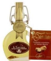
白トリュフオイル 40mm （イタリア） 価格:2,547円