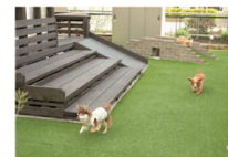
地面は愛犬の尿の負担とメンテナンスを考慮して、