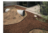
犬種によってはトンネルが好きな犬も。