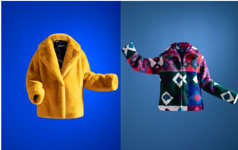
La Hairy 49,900円（税込）