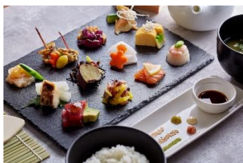
体験 Dining 和色 -WASHOKU-