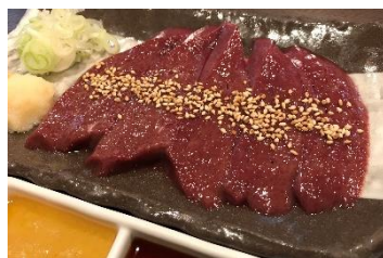
串焼き居酒屋福家