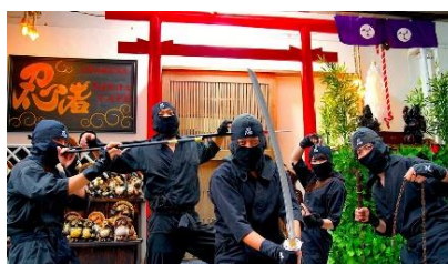
NINJA Cafe & Bar