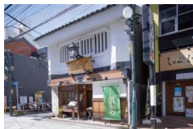
とんかつ 濱かつ 本店

リンガーハットの第1業態は、実はとんかつ屋さん。「とんかつ 濱かつ 本店」は、住所はもちろん、建物のアウトラインも創業当時の趣をそのままに残しており、九州を中心に展開する老舗として、今も愛され続けています。