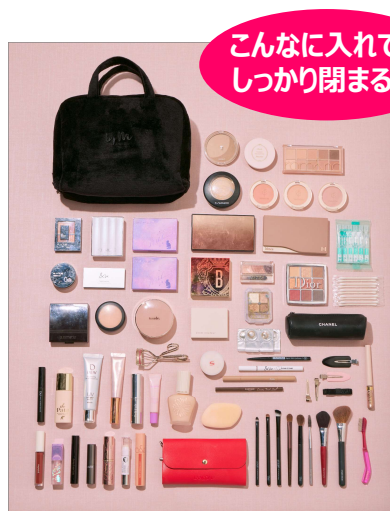
『かわにしみきプロデュース ズボラでも収納できる! BIGマルチポーチBOOK』 発売日:2022年1月20日 価格:2178円(税込)