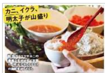
アパホテル(水戸駅北)