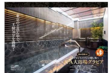
アパホテル(上野駅前)

★宝島社のリリース一覧はこちら★ https://tkj.jp/company/release