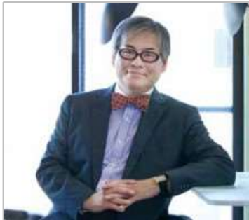
ホテル評論家・滝澤信秋