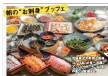
アパホテル(札幌すすきの駅前)