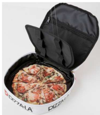
イタリアンバジル (S/M)