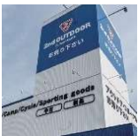
▲アウトドア専門店

セカンドストリートには、アパレルやブランド、アウトドア、おもちゃの専門店など、特徴的なショップタイプが9つあります。