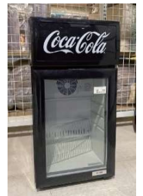
▲海外企業アイテムも多数