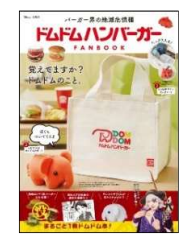
『ドムドムハンバーガー FANBOOK』 発売日：2022年5月6日 価格：2794円（税込）