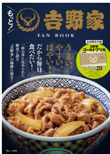
『もっと！吉野家 FAN BOOK』 発売日：2022年11月1日 定価：990円（税込）