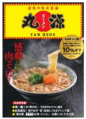
『丸源ラーメン FAN BOOK』 発売日：2022年5月24日 定価：990円（税込）