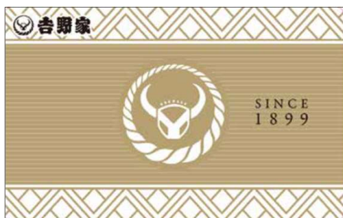
※吉野家ゴールドプリカは、「吉野家プリカ」の本誌限定デザインです ※利用方法などの注意事項は、本誌でご確認ください