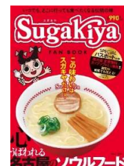
『スガキヤ FAN BOOK』 発売日：2022年7月21日 定価：990円（税込）

各チェーンのファンに楽しんでもらえるのはもちろん、社長インタビューをはじめ、歴史、商品開発秘話、そのチェーンのファンであるタレントのインタビューなども掲載しています。そのため、コラボした各企業からは「新入社員から全国各店舗の従業員まで自社事業について理解が深まり、モチベーションアップにつながった」という声を多数いただき、社内報のような形で活用していただいています。