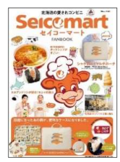
『セイコーマート FANBOOK』 発売日：2022年7月28日 価格：2580円（税込）