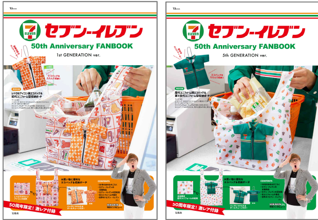
左：『セブン-イレブン 50th Anniversary FANBOOK 1st GENERATION ver.』 右：『セブン-イレブン 50th Anniversary FANBOOK 5th GENERATION ver.』 発売日：2023年11月7日／価格：2486円(税込) セブンネットショッピング、セブン-イレブンおよび宝島チャンネルにて販売 ※一部の店舗では取り扱いがない場合があります

「セブン-イレブン」の公式ファンブックを、2023年11月7日(火)に2種同時発売します。