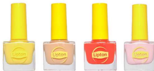
レモンティー ミルクティー アップルティー ピーチティー