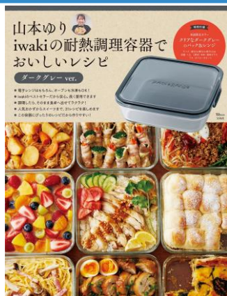
TJ MOOK『山本ゆり iwakiの耐熱調理容器でおいしいレシピ ダークグレーver.』