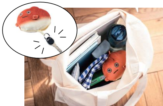
▲ファスナーに鍵を付けて キーケースにも！

※キーケースとして使用する場合はカバンの中に入れてください 【サイズ（約）】ポーチ：高さ60×幅100×マチ50mm 各ジップバッグ：縦290×横226 厚さ0.08mm