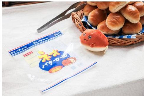
▲ほんものと見分けがつかないほど そっくりなパッケージデザイン