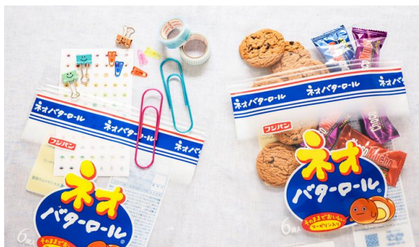
▲食品衛生検査済みだから食品を入れてもOK！ おやつに文具、好きなものを入れられます

※キーケースとして使用する場合はカバンの中に入れてください 【サイズ（約）】ポーチ：高さ60×幅100×マチ50mm 各ジップバッグ：縦290×横226 厚さ0.08mm