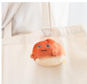
▲ボールチェーン付きだから 一緒にお出かけも！