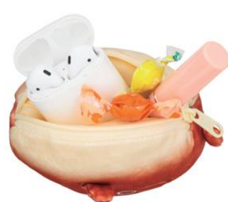
▲リップやイヤホンなど 小物収納にピッタリ