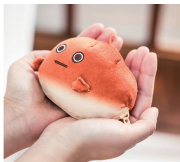
▲かわいい手のひらサイズ

ふわふわぬいぐるみポーチは手のひらサイズ。ボールチェーンが付いているから一緒にお出かけできます。ジップバッグはネオバターロールの袋とほぼ同じサイズ。食品衛生検査済みだから、食品にも使用可能です。