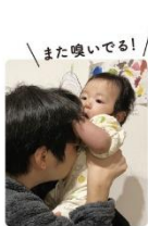
赤ちゃん特有の匂いってありますよね。育児や仕事で疲れたときに、ふと匂いを嗅いで癒やされていました。そろそろ匂いが薄れてきて、少し悲しい。

赤ちゃん特有の匂いを堪能 しておりました。 スタッフの心が 落ち着くので、 ご協力いただけると 幸いです。