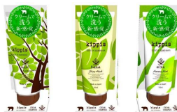
kippis®クリームシャンプー

クリームタイプのオールインワンシャンプー「kippis®クリームシャンプー」を2017年4月に発売。LOFT、東急ハンズをはじめとする全国のバラエティショップ200店舗以上で展開。