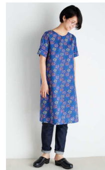
NIMES(ニーム) ビルビネン柄のワンピース

テキスタイルを用いたワンピースなどを、全国の「ニーム」直営店10店舗およびECサイトで2017年7月より発売。