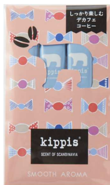
SMOOTH AROMA (スムーズアロマ) デカフェ