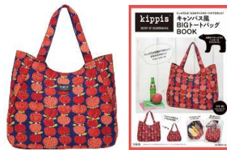
【kippis キャンパス風BIGトートバッグ BOOK】 2016年8月22日発売

ファッション雑誌や、バッグやポーチなどのブランドアイテム付録を開発する宝島社が、開発・プロデュースした北欧発のライフスタイルブランド。フィンランド在住のデザイナーが描く、北欧の自然や暮らしをモチーフにした温かみのあるテキスタイルが特徴です。編集部自ら、オリジナルテキスタイルの開発・プロデュースを行い、「kippis®」として創設しました。2012年から自社商品(出版物)としてバッグや傘、手帳などを販売してきましたが、反響が大きく、ご好評をいただいたことから「オリジナルブランド」として、2015年10月よりライセンス事業をスタート。これまでバッグブランド「レスポートサック」や川辺(株)、(株)サンヒットなどのメーカーにデザイン提供を行っています。