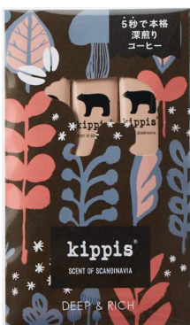
DEEP & RICH (ディープ&リッチ) 深煎り ※今回新たに制作