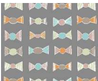
Konvehti チョコレート包み