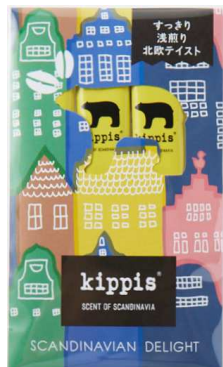
SCANDINAVIAN DELIGHT (スキャンジナビアン デライト) 浅煎り ※今回新たに制作