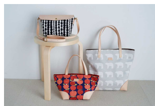
kippis® × kissora(キソラ) コラボレザーバッグ