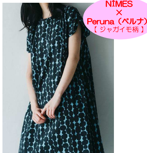
NÎMES × Peruna (ペルナ) 【ジャガイモ柄】