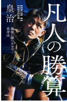
『凡人の勝算 最後に勝つヤツの思考法』 定価：本体1400円＋税 発売日：2021年2月26日