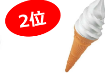
ソフトクリーム レギュラー