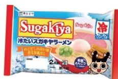
Sugakya冷たいスガキヤラーメン 2人前(チルド)