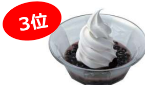
クリームぜんざい