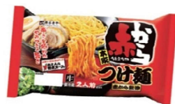
赤からつけ麺 2人前(チルド)