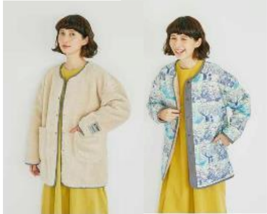
■リバーシブルポアジャケット