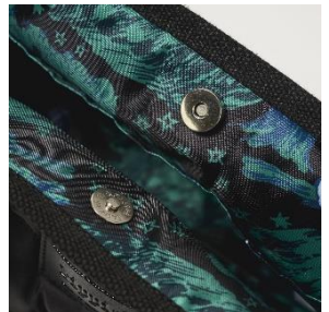
▲開閉しやすい マグネットボタン