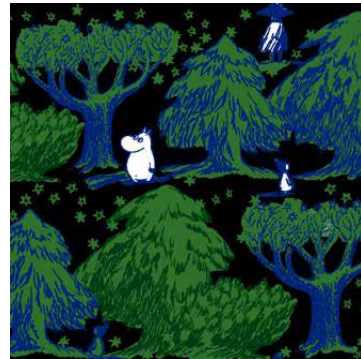
▲生地はコラボ限定柄「Starry Valley」