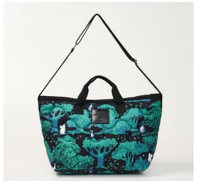
■キルティングバッグ