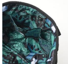
▲スマホも入る 内ポケット2つ