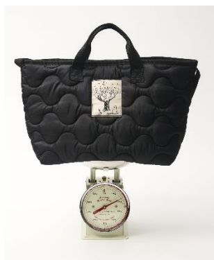
▲りんごより軽い約210g