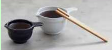
〈かもしか道具店〉 納豆鉢、納豆のませ棒