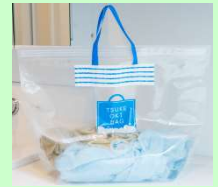
〈グラフィコ〉 酸素系漂白剤用漬けおきバッグ