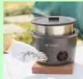
〈タイガー〉 魔法のかまどごはん KMD-A型

ハンガー部分が開閉するので、 シャツの首を 伸ばさずに干せ、 取り込むときは中央をつまむだけ！