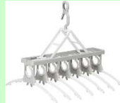
〈ツインモール〉 洗濯物干し 7連ガー

ハンガー部分が開閉するので、 シャツの首を 伸ばさずに干せ、 取り込むときは中央をつまむだけ！