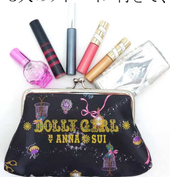
今月の豪華ブランドアイテム付録 ドーリーガール バイ アナ スイの きらきらビジュア付きがま口ポーチ ※ポーチ以外は付録に含まれません

毎月豪華と話題の付録は「ドーリーガール バイ アナ スイのきらきらビジュア付きがま口ポーチ」。ミラーやリボンなど、ガーリーなモチーフをちりばめた、クリスマスにもぴったりな、ロマンティック柄を全面にプリントしたスペシャルアイテムです。