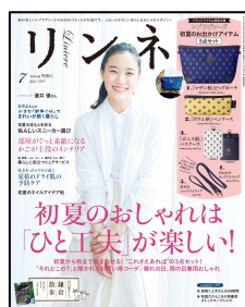
『リンネル』 毎月20日 発売

昨今、様々な企業が「暮らし系」をターゲットにした商品の企画・開発を行うなど、新市場「暮らし系」への注目が年々高まっています。