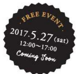
Illustration: Sachiko Watanabe

いよいよ開催迫る『リンネル』×『大人のおしゃれ手帖』の「心地よい暮らしフェスタ2017」@二子玉川! 今回は直前スペシャルということでイベントの魅力をぎゅっとまとめて綴ざらいます!