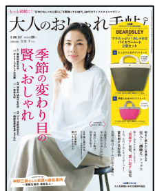
『大人のおしゃれ手帖』 毎月7日 発売