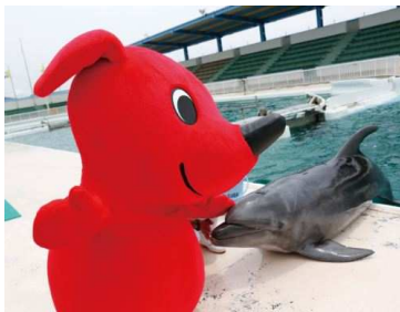
ブランドムック®『チーバくん』 価格: 本体1310円+税 発売: 2014年6月24日