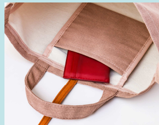
便利な内ポケットつき