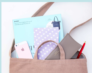
雑誌も入る大きめサイズ