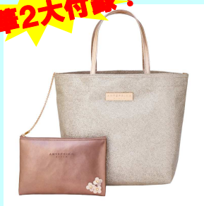
アンテプリマ/ミスト グリッタートート&バッグインポーチ