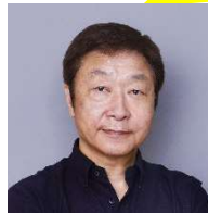
カリスマ予備校講師 名著『論理エンジン』開発者 出口 汪